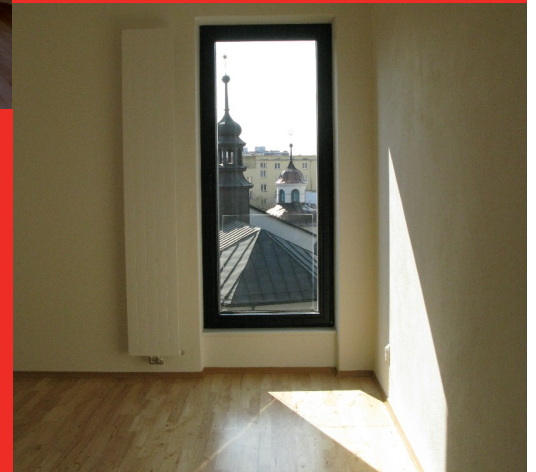
Výhled z ložnice