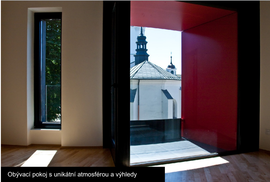
Obývací pokoj s unikátní atmosférou a výhledy