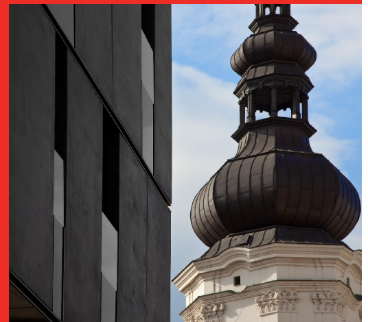
Unikátní kontrast moderní architektury a historie